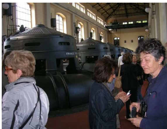
Saiarino: la sala pompe dell'impianto idrovoro