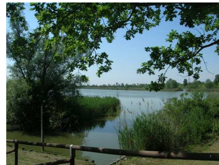
Oasi di Val Campotto