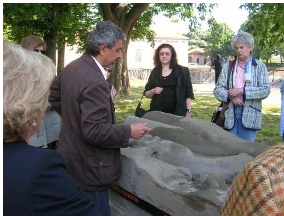
Saiarino: Museo all'aperto