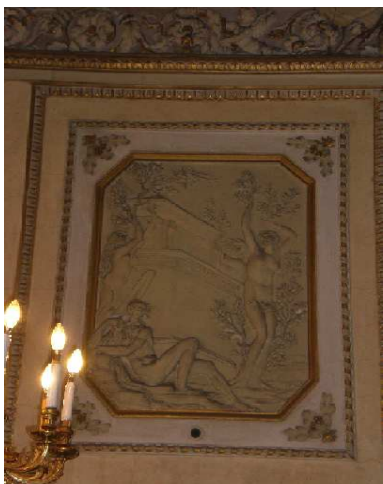
Luigi Acquisti: Eridano e le Eliadi