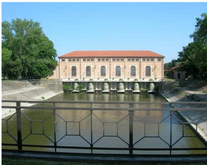
Stabilimento idrovoro di Salarino

È stata quindi effettuata un'escursione agli impianti che controllano la bassa pianura bolognese, durante la quale è stato illustrato il funzionamento delle idrovore e delle porte vinciane.