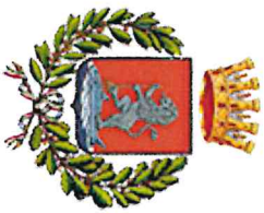
Comune di Orbetello