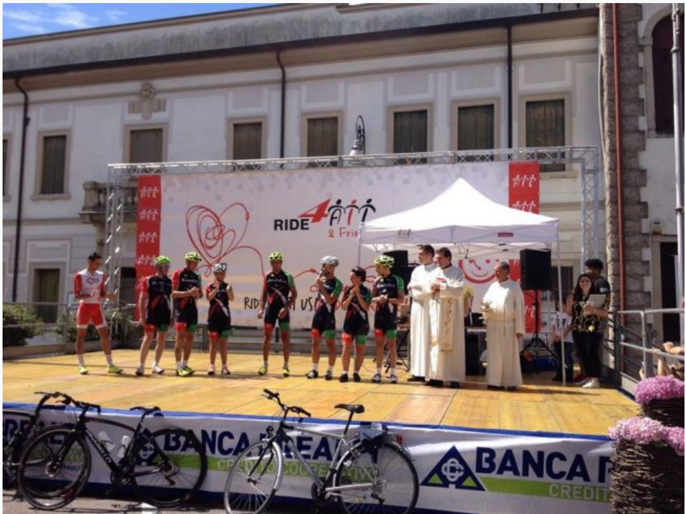
Una delle tappe di Ride for Ail

La città della carta nel pomeriggio sarà la tappa finale dell'iniziativa a sostegno dell'associazione italiana contro le leucemie, linfomi e mielomi. Sabato mattina sarà inaugurata anche l'area commerciale, con la donazione da parte del club service