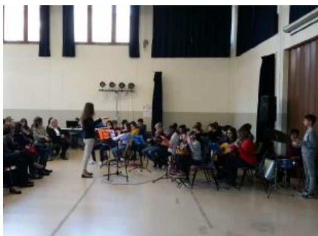
Il concerto dell'orchestra della scuola media Maffei.

I club Lions regalano due casse acustiche alla scuola media Maffei