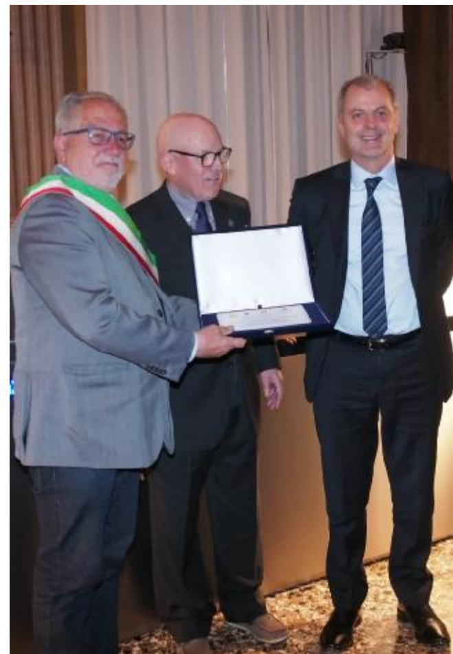
La cerimonia a palazzo Bonin Longare sede di Confindustria