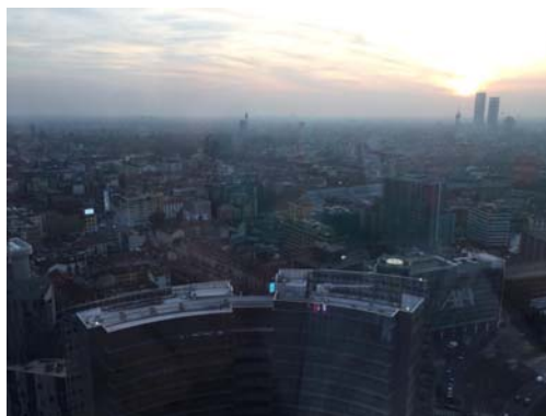
Vista su Milano

Trasferimento in pullman al teatro alla Scala di Milano ove abbiamo potuto ammirare le 2 étoile Roberto Bolle e Svetlana Zakharova protagonisti nel balletto L'histoire de Manon . Grande emozione e coinvolgimento del pubblico in Teatro. Una serata scaligera eccezionale.