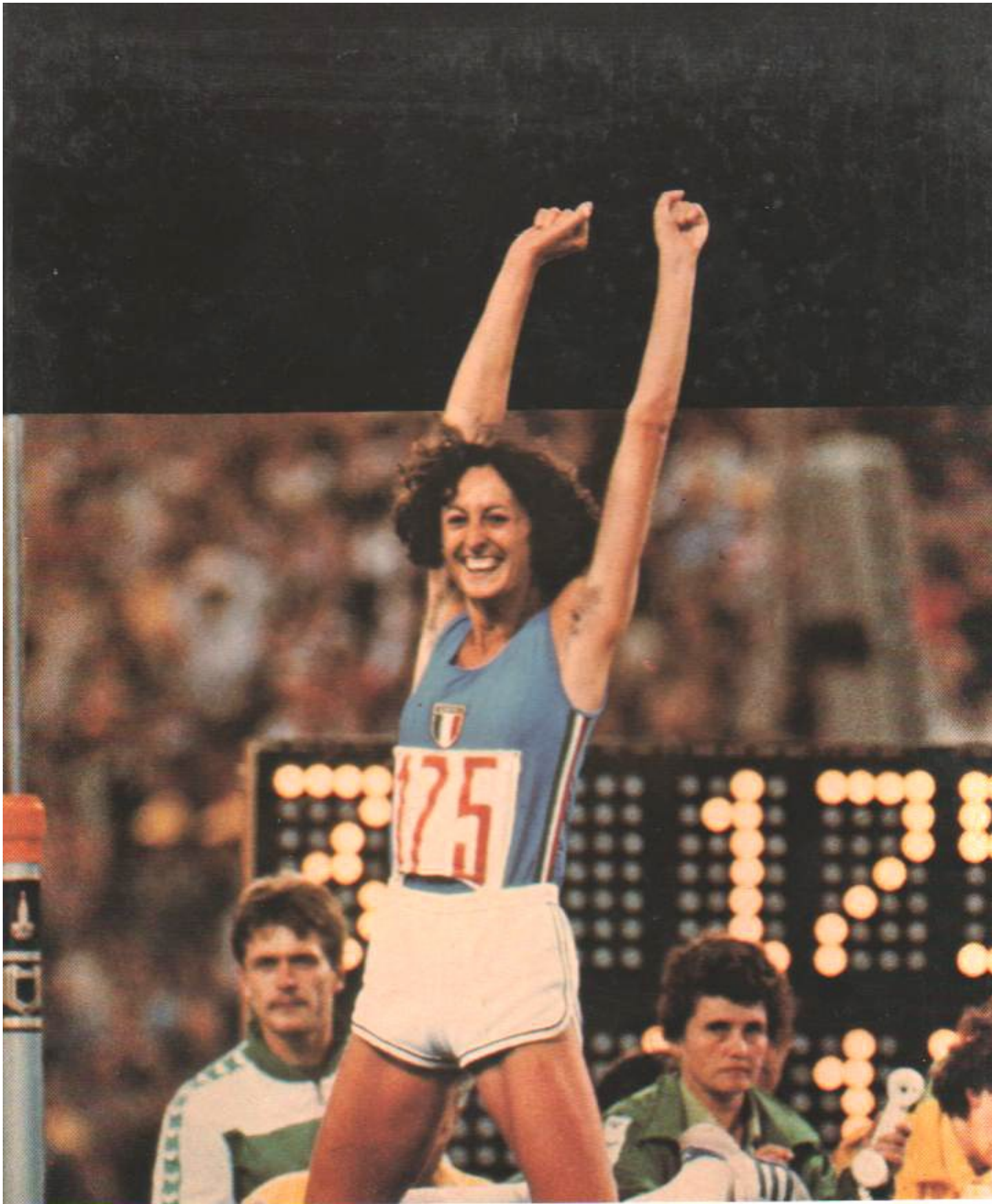
Sara Simeoni simbolo dell'atletica italiana negli anni ottanta. Specialista nel salto in alto, ha vinto l'oro alle Olimpiadi di Mosca 1980 e ha contribuito alla visibilità delle donne nello sport italiano.