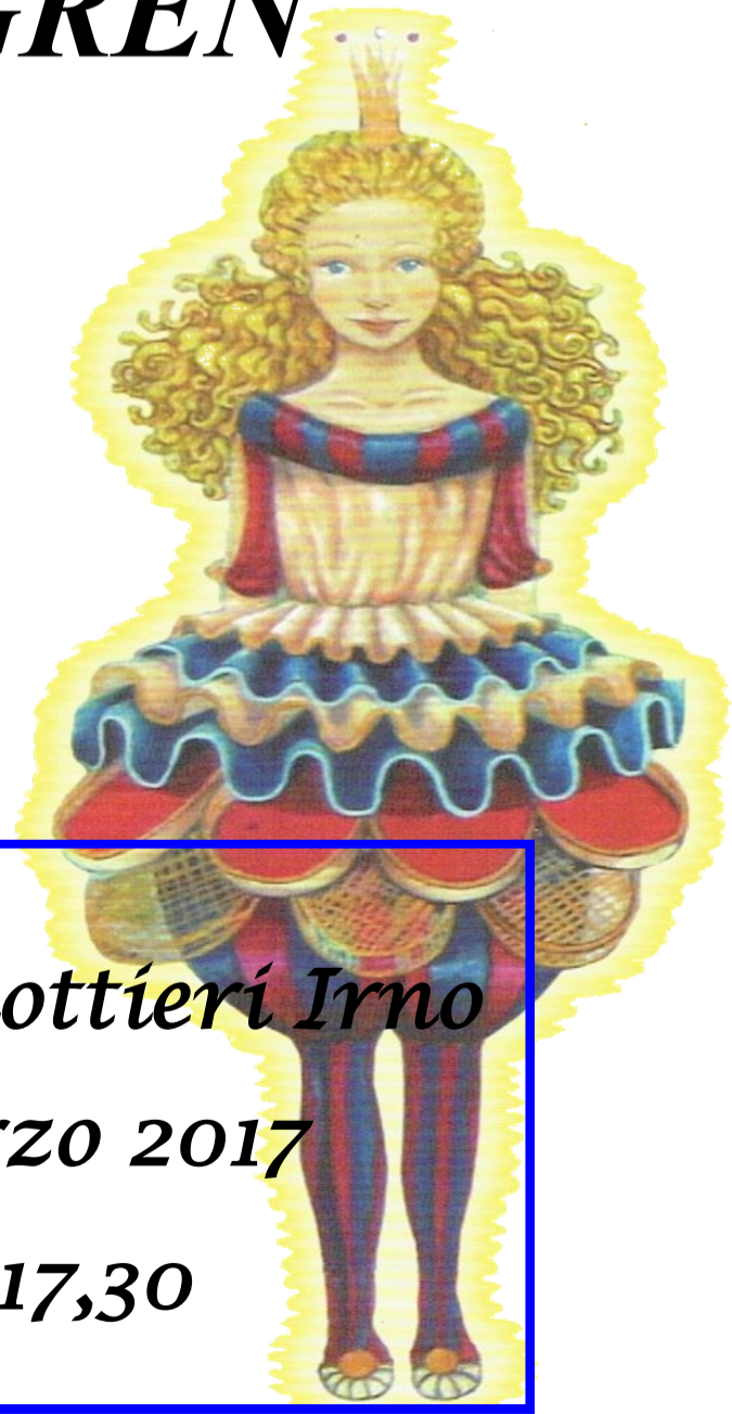
la Principessa Luce