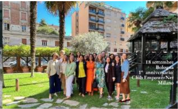
18 settembre Bologna 1° anniversario Club EmpowerNet Milano