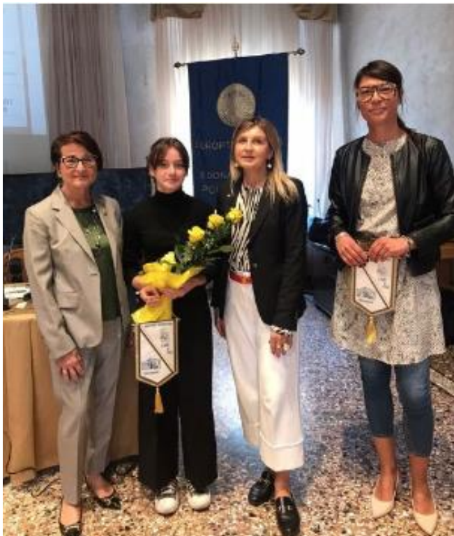
7 ottobre, San Donà del Piave 50° Anniversario del club di Portogruaro