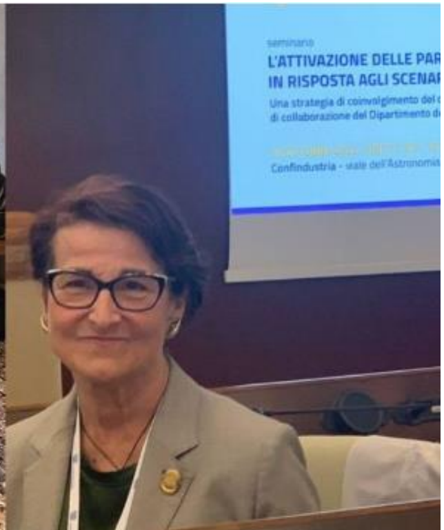
10 ottobre, Roma Seminario Protezione Civile