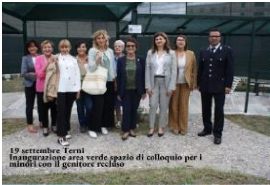
19 settembre Terni Inaugurazione area verde spazio di colloquio per i minori con il genitore recluso