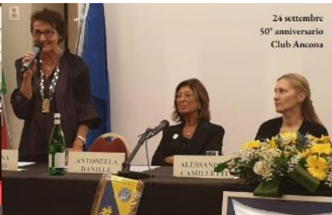
24 settembre 50° anniversario Club Ancona