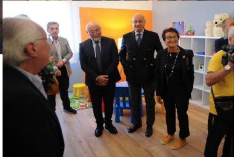
In alto a sinistra 1 ottobre, Livorno Cerimonia di premiazione Bando STEM "Francesca Calabrese De Feo"