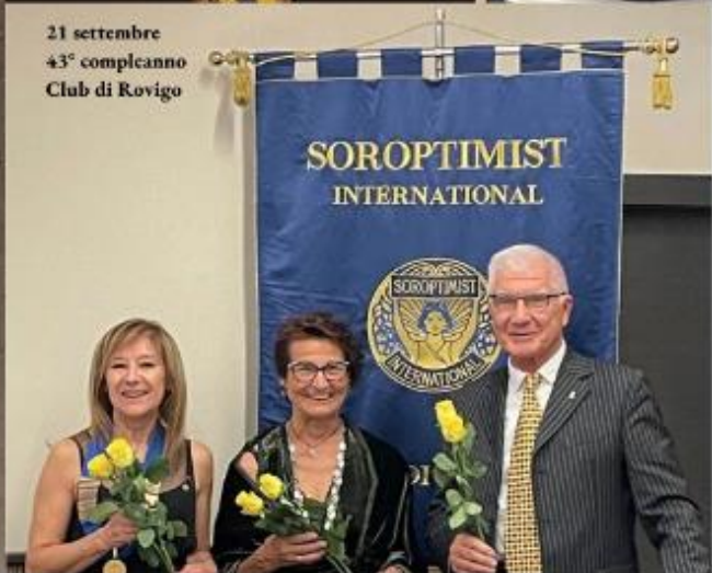
21 settembre 43° compleanno Club di Rovigo