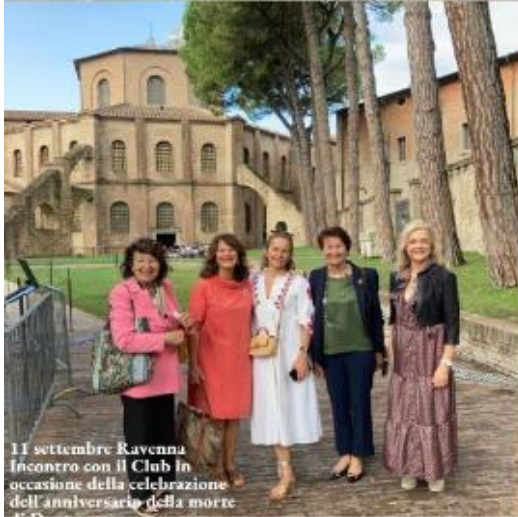
11 settembre Ravenna Incontro con il Club in occasione della celebrazione dell'anniversario della morte