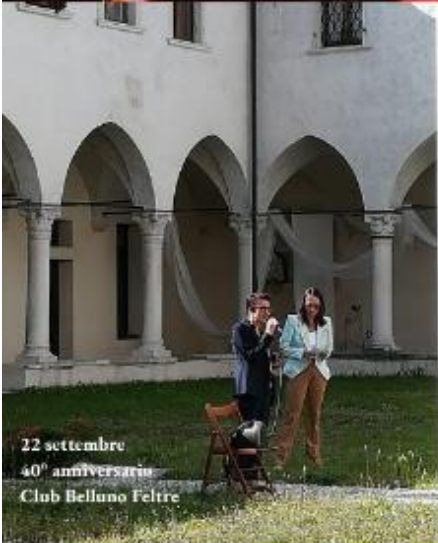
22 settembre 40° anniversario Club Belluno Feltrina