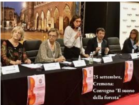
25 settembre, Cremona; Convegno "Il suono della foresta"