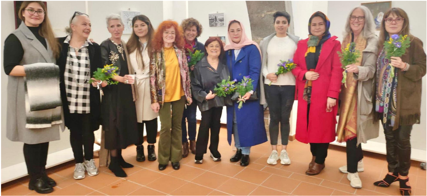
Il Club L'Aquila con alcune "Cicliste Afghane"