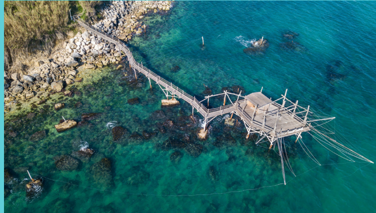
TRABOCCO TURCHINO - LUOGO DEL CUORE FAI

ORE 23,00 CIRCA RIENTRO IN HOTEL PER IL PERNOTTAMENTO.