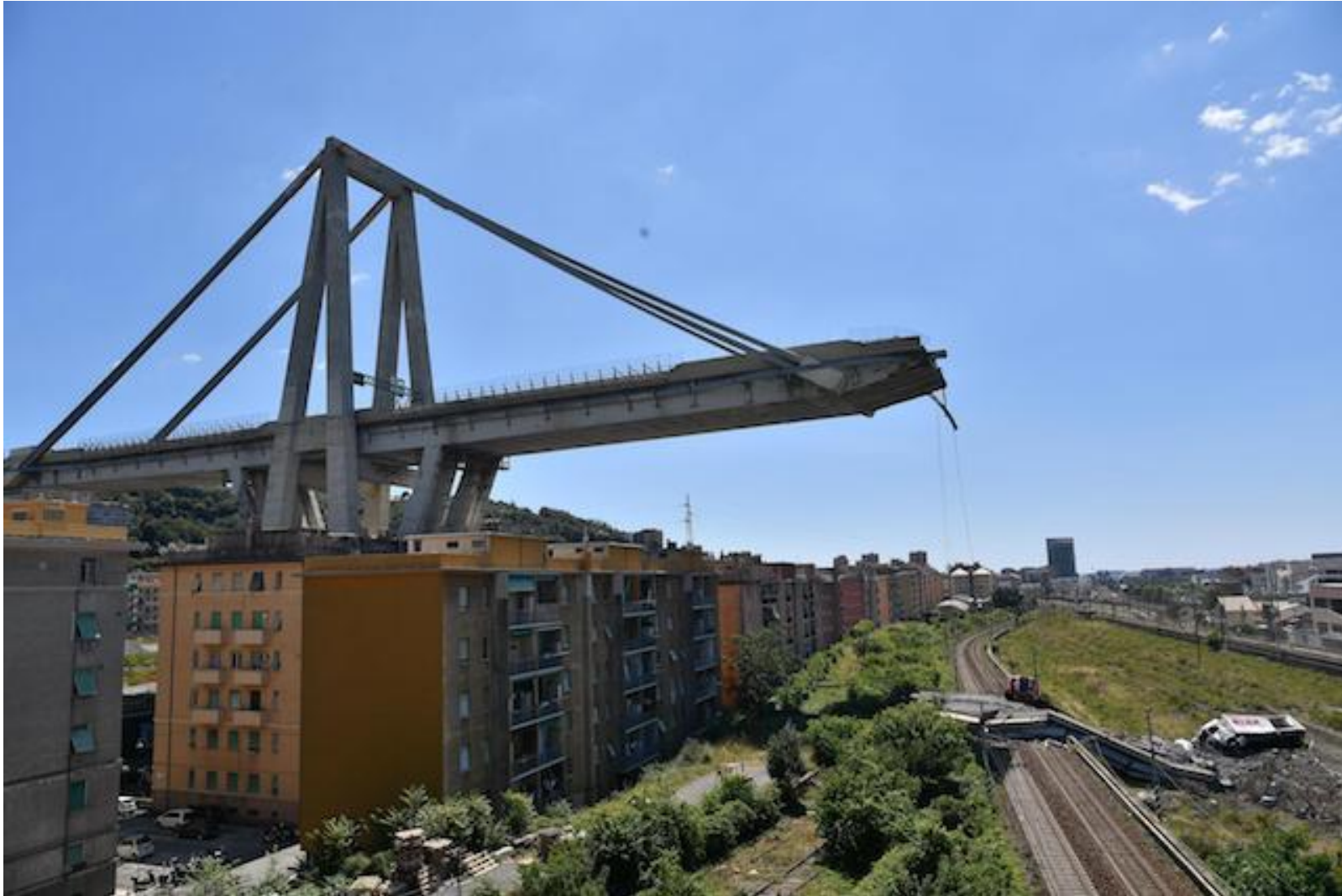
Il disastro di Genova. L'immagine più simbolica.